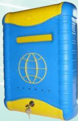
Ящик для обращений

Коммуникативная система быстрого реагирования на просьбы о помощи и анонимные запросы