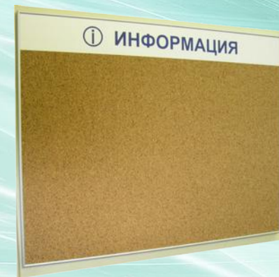
Стенд ответов на анонимные обращения